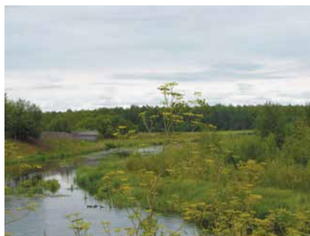
«Уральская деревушка» Стёпа, 7л