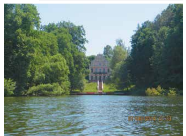
«Голландский домик», Анастасия, 7л

• Средства на реабилитационное лечение девочки можно отправить на имя её бабушки – Гурьевой Нины Ивановны • Реквизиты: Сбербанк • Банк получателя доп офис 9038/01718 • Кор счет 3010181040000000225 БИК 044525225 • счет 42307 810 1 3806 7313015